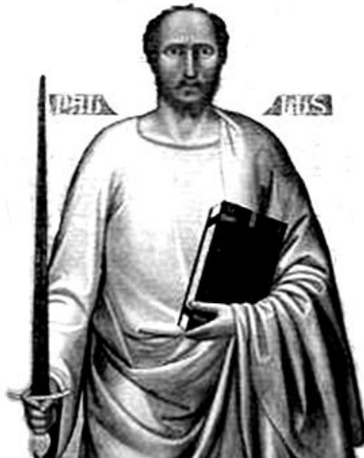
Pablo de Tarso por Bernardo Daddi c. 1333

“Y ahora, hermanos, os encomiendo a Dios y a la palabra de su gracia, a aquel que tiene poder para edificar y para dar herencia entre todos los santificados.