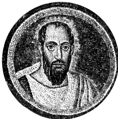
Pablo de Tarso

© La Auténtica Sabiduría Cristiana del Apóstol Pablo